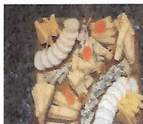
Plateau de fromage cocktail mini 18 personnes